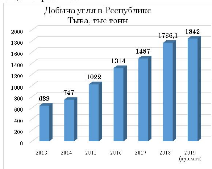
Динамика объема добычи угля