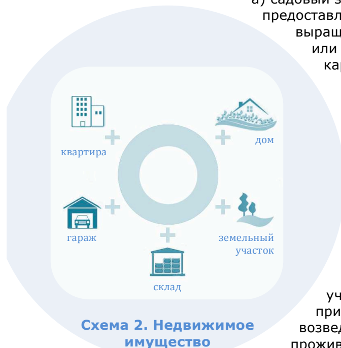
Схема 2. Недвижимое имущество