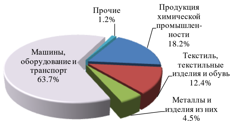
Товарная структура импорта в 2018 году

Наибольшую часть (63,7%) стоимостного объема импорта занимает ввоз машин, оборудования и транспортных средств (шахтные самосвалы, буровые установки, оборудование для подземных работ из Китая). Стоимость поставок машиностроительной продукции составила 8,3 млн. долларов США и увеличилась по сравнению с 2017 годом в 1,6 раза. Ввоз продукции химической промышленности (18,2%, цинк сернокислый, сода каустическая, шины пневматические резиновые новые) вырос в 1,5 раза при снижении ввоза металлов и изделий из них в 3,4 раза, текстильных изделий и обуви – на 0,8%.